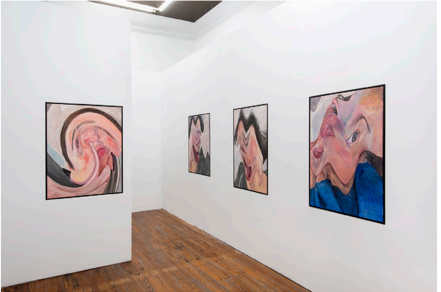
Vistas de la exhibición en sala 1 | Galerie Des Glases