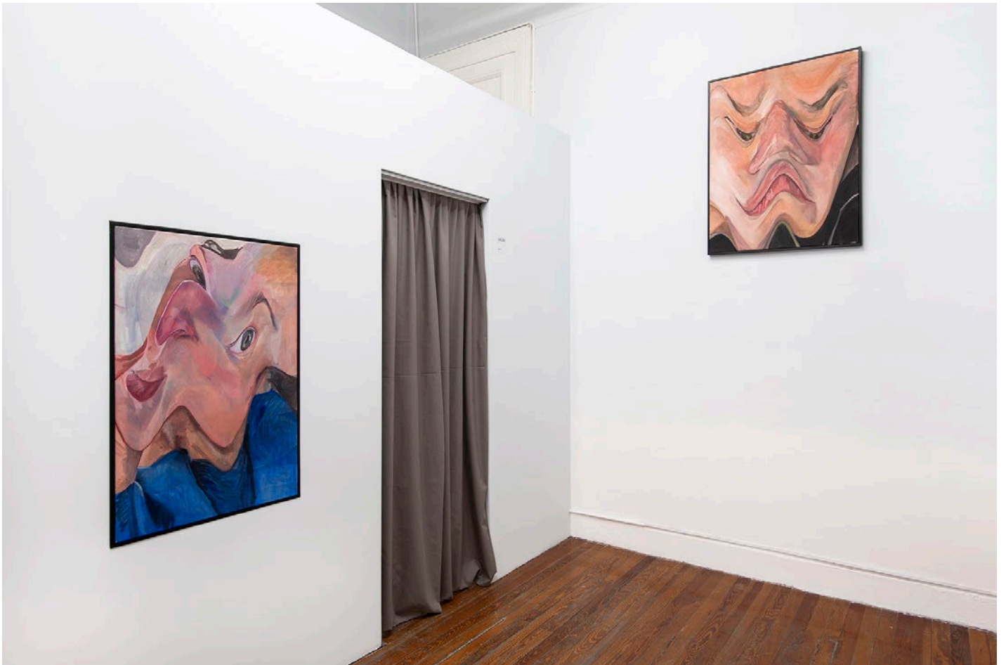
Vistas de la exhibición en sala 1 | Galerie Des Glases